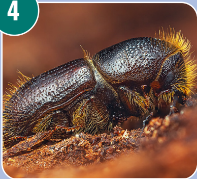
Insekten heter: J - Granbarkborre