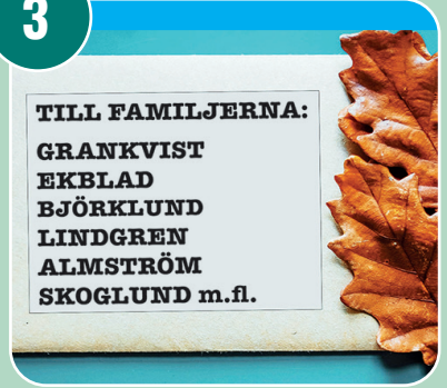
Bilden passar med bokstaven: H