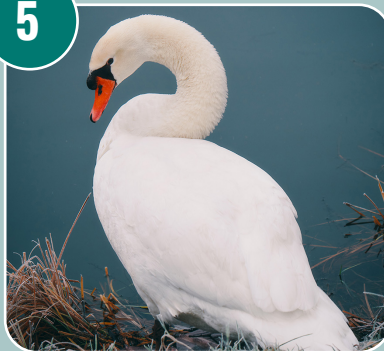
Fågeln heter: A - Knölsvan