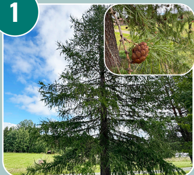
Trädet heter: E - Sibirisk lärk