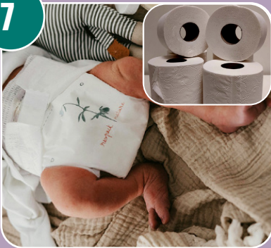
Bilden passar med bokstaven: C