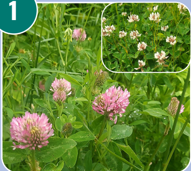
Blomman heter: D - Klöver (vit och röd)