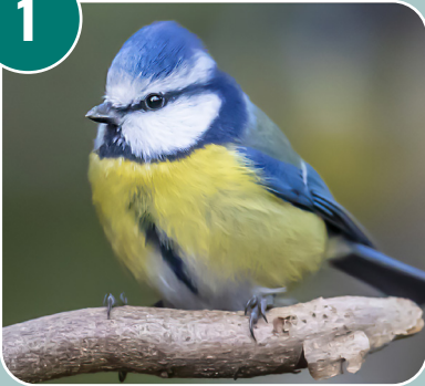
Fågeln heter: E - Blåmes