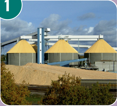
Bilden passar med bokstaven: E