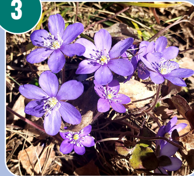
Blomman heter: H - Blåsippa