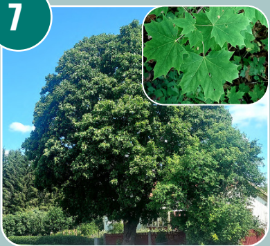
Trädet heter: D - Skogslönn