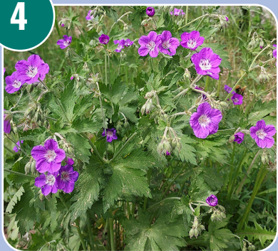
Blomman heter: B - Midsommarblomster