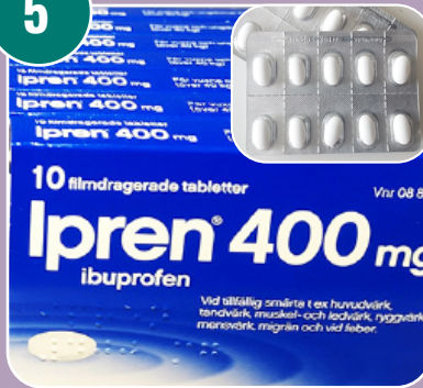
Bilden passar med bokstaven: A