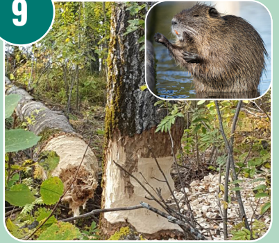
Bilden passar med bokstaven: K