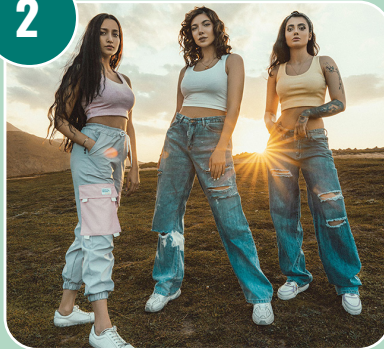
Bilden passar med bokstaven: J