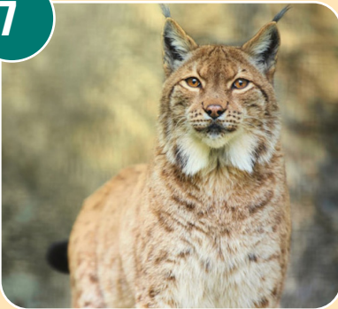
Djuret heter: B - Lodjur