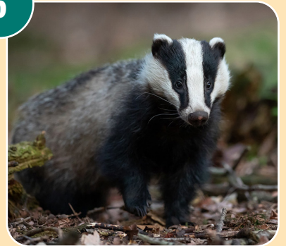
Djuret heter: G - Grävling