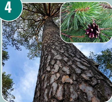
Trädet heter: K - Tall