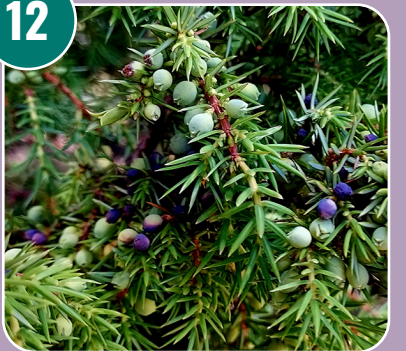
Bärkotten heter: I - Enbär