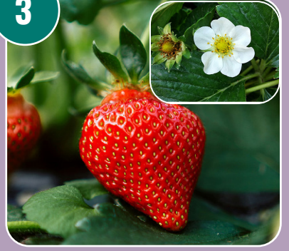
Skenfrukten heter: K - Jordgubbar