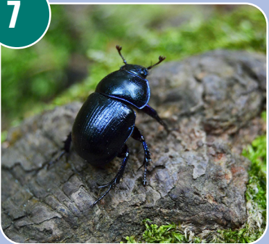
Insekten heter: H - Fälttordyvel