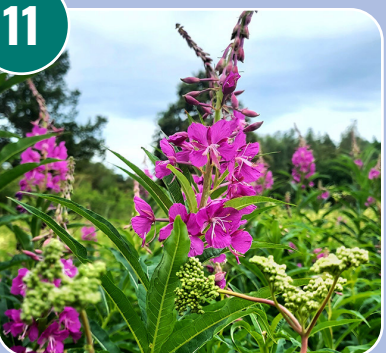
Blomman heter: E - Rallaros/Mjölkört