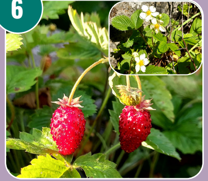
Skenfrukten heter: B - Smultron