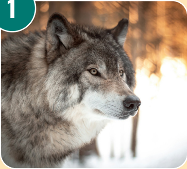
Djuret heter: F - Varg