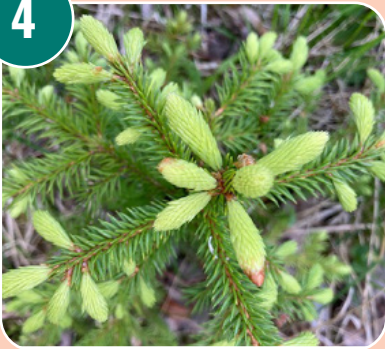
Bilden passar med bokstaven: J