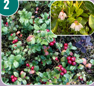
Bäret heter: F - Lingon