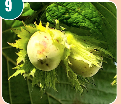
Bilden passar med bokstaven: E