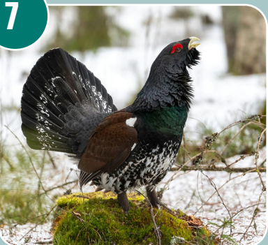
Fågeln heter: K - Tjäder