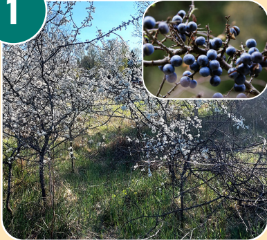
Busken heter: E - Slånbärsbuske (slån)