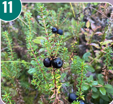
Stenfrukten heter: H - Kråkbär