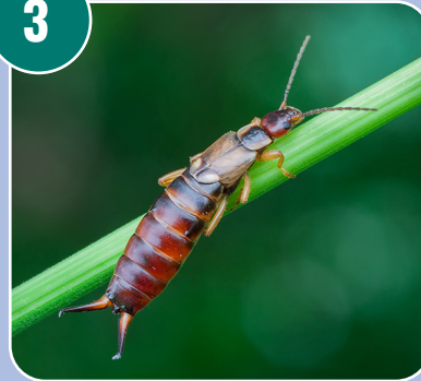
Insekten heter: K - Tveskärt