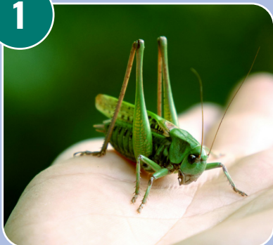
Insekten heter: F - Vårtbitare