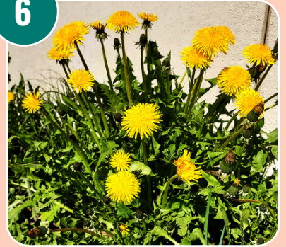
Bilden passar med bokstaven: A