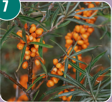
Nöten heter: C - Havtorn