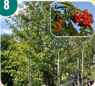
Busken heter: G - Rönn