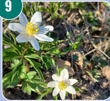
Blomman heter: K - Vitsippa