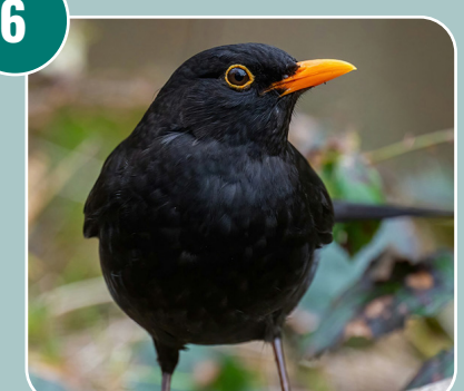
Fågeln heter: B - Koltrast