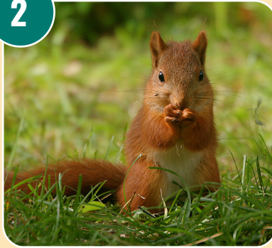
Djuret heter: J - Ekorre