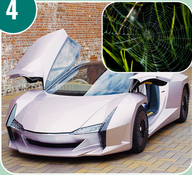
Bilden passar med bokstaven: A