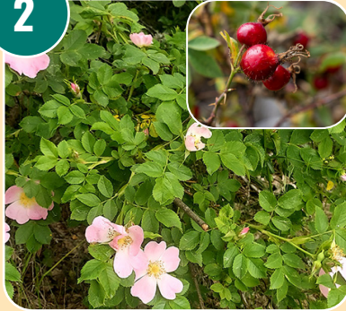
Busken heter: I - Nyponbuske (nypon/ros)