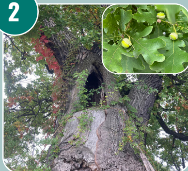
Trädet heter: A - Ek