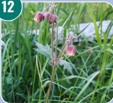
Blomman heter: I - Humleblomster