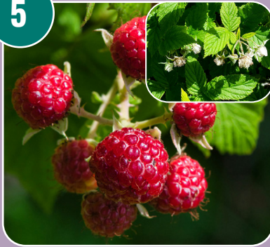
Stenfrukten heter: A - Hallon