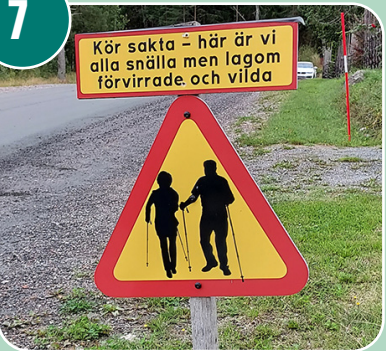
Bilden passar med bokstaven: F