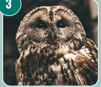
Fågeln heter: I - Kattuggla