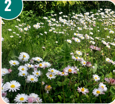
Bilden passar med bokstaven: L