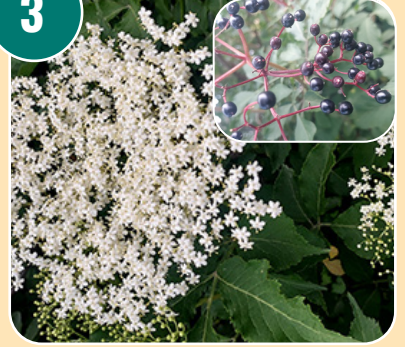
Busken heter: A - Äkta fläder