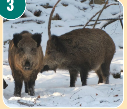
Djuret heter: D - Vildsvin