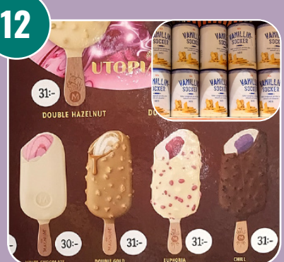
Bilden passar med bokstaven: G