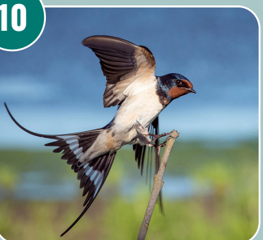
Fågeln heter: F - Ladusvala