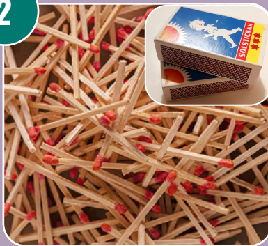
Bilden passar med bokstaven: I