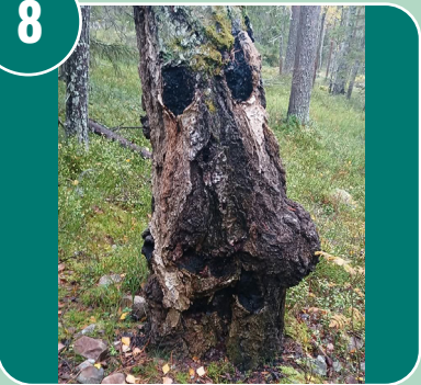
Bilden passar med bokstaven: L