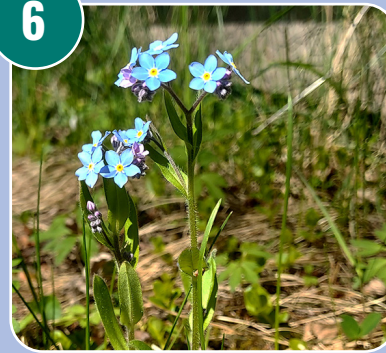
Blomman heter: L - Förgätmigej