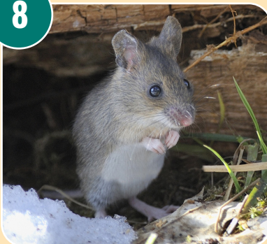
Djuret heter: L - Skogsmus