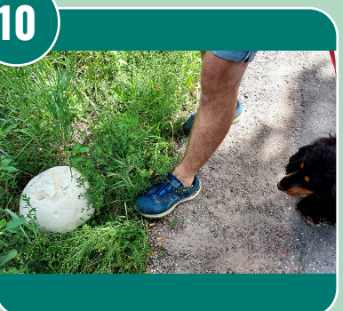
Bilden passar med bokstaven: E