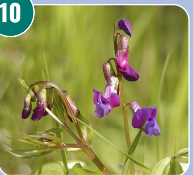
Blomman heter: G - Gökärt