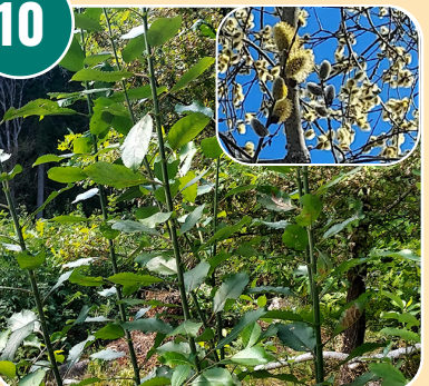
Busken heter: H - Sälg (Salix)