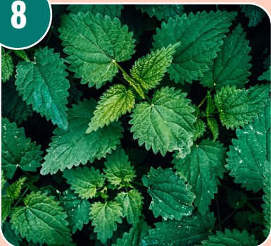
Bilden passar med bokstaven: K