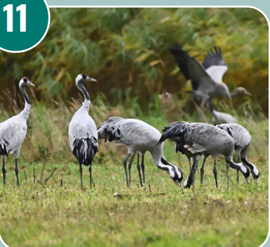
Fågeln heter: H - Trana