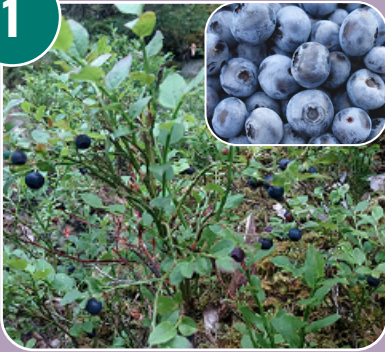
Bäret heter: J - Blåbär