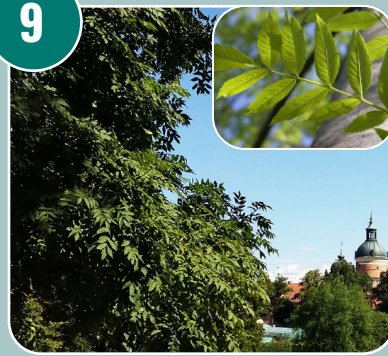
Trädet heter: C - Ask