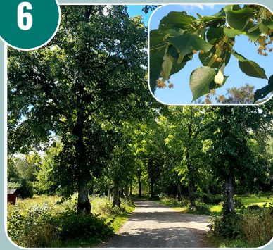
Trädet heter: L - Skogslind