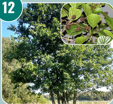
Trädet heter: H - Klibbal