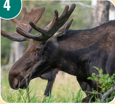
Djuret heter: K - Älg