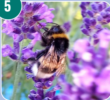
Insekten heter: B - Humla