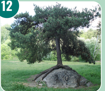
Bilden passar med bokstaven: G