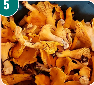
Bilden passar med bokstaven: B