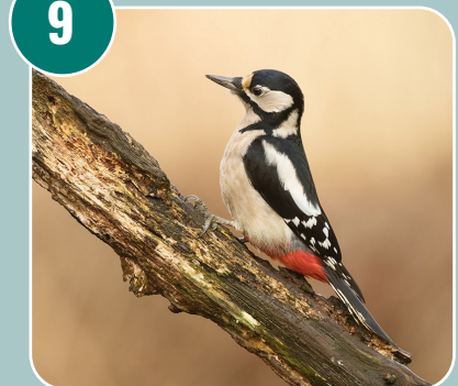
Fågeln heter: D - Större hackspett