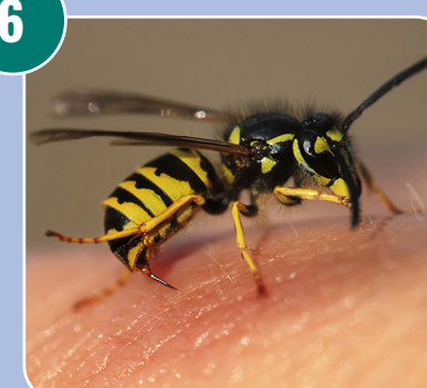
Insekten heter: A - Geting