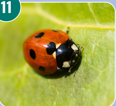
Insekten heter: D - Nyckelpiga (sjuprickig)