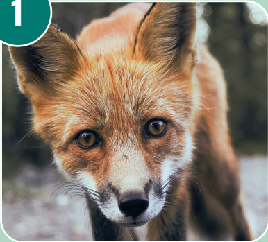
Bilden passar med bokstaven: D