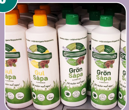
Bilden passar med bokstaven: B