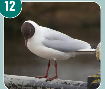
Fågeln heter: L - Skrattmås