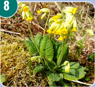
Blomman heter: J - Gullviva