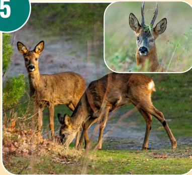
Djuret heter: A - Rådjur