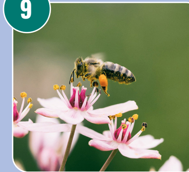
Insekten heter: L - Honungsbi