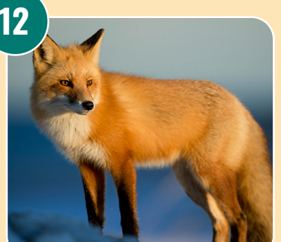
Djuret heter: H - Rödräv