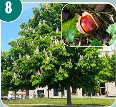
Trädet heter: G - Hästkastanj