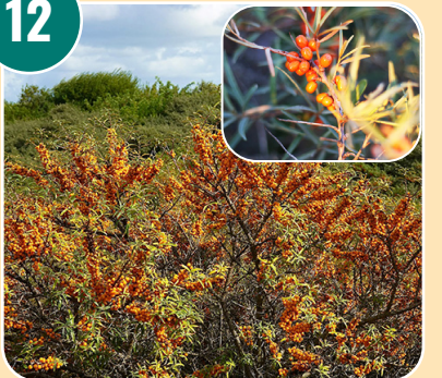
Busken heter: K - Havtorn