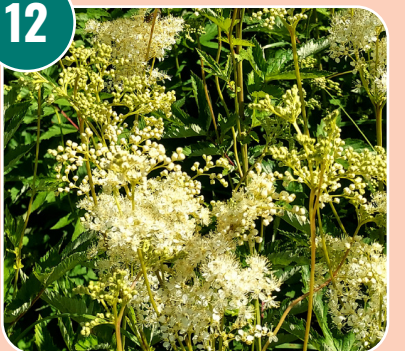
Bilden passar med bokstaven: I