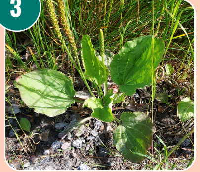
Bilden passar med bokstaven: H