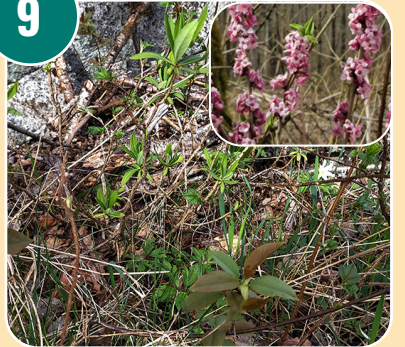
Busken heter: D - Tibast