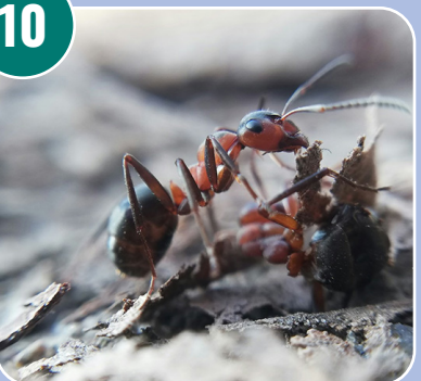
Insekten heter: E - Skogsmyra