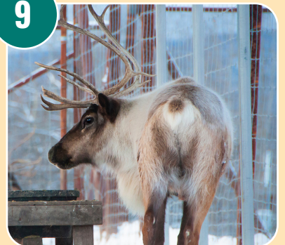
Djuret heter: C - Ren