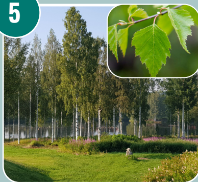
Trädet heter: B - Björk