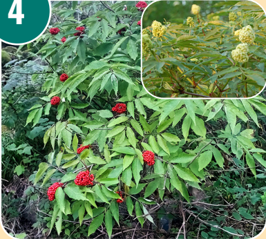
Busken heter: F - Druvfläder