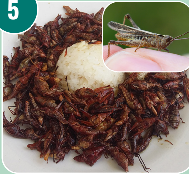
Bilden passar med bokstaven: B