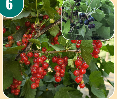
Busken heter: C - Vinbär (röd/svart)