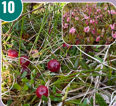
Stenfrukten heter: G - Tranbär