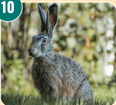
Djuret heter: I - Fälthare