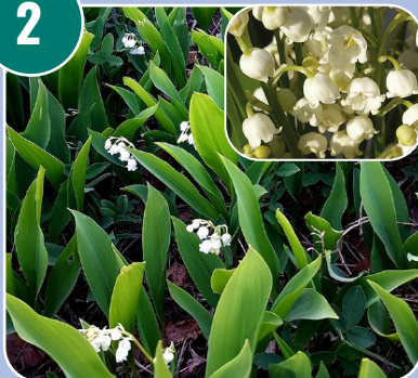
Blomman heter: F - Liljekonvalj