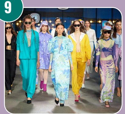
Bilden passar med bokstaven: D