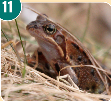
Djuret heter: E - Vanlig groda