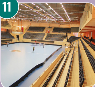
Bilden passar med bokstaven: L