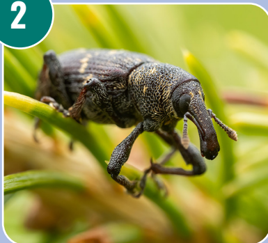
Insekten heter: G - Snytbagge