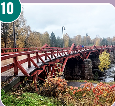
Bilden passar med bokstaven: F