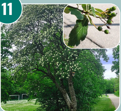
Trädet heter: I - Oxel (Svenskoxel)