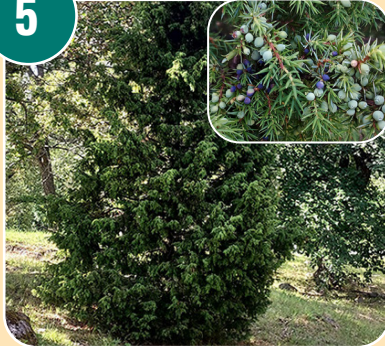
Busken heter: B - Enbuske