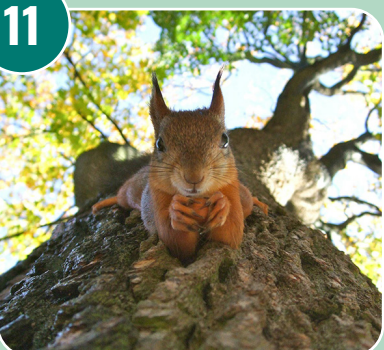
Bilden passar med bokstaven: I