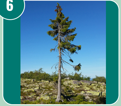
Bilden passar med bokstaven: C