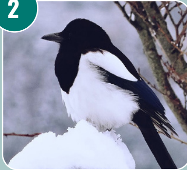
Fågeln heter: G - Skata