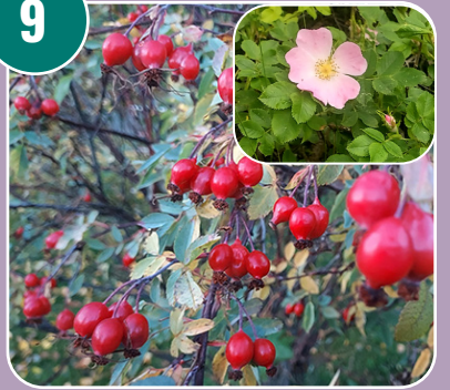
Stenfrukten heter: E - Nyon