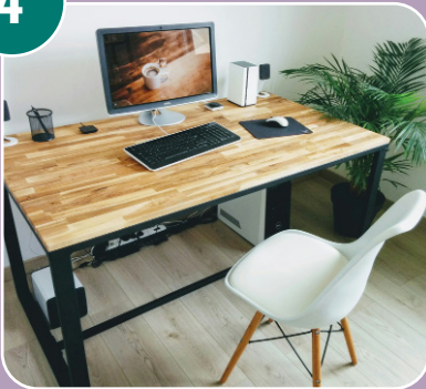
Bilden passar med bokstaven: J