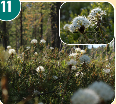
Busken heter: J - Skvattran