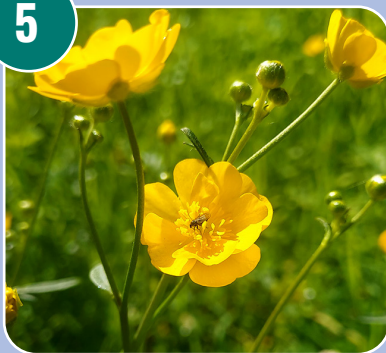
Blomman heter: A - Smörblomma