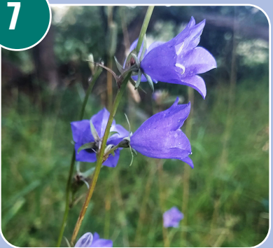
Blomman heter: C - Blålocka