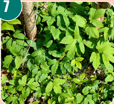
Bilden passar med bokstaven: F