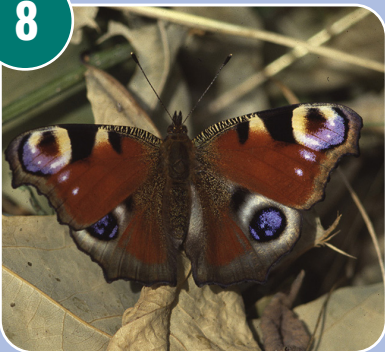
Insekten heter: C - Fjäril (Påfågelläga)