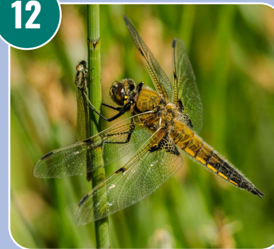
Insekten heter: I - Slända (Mosaik)