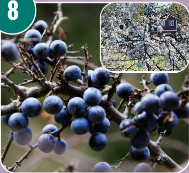
Stenfrukten heter: D - Slånbär