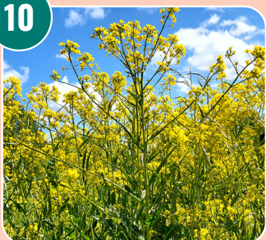
Bilden passar med bokstaven: G