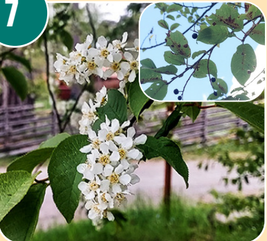
Busken heter: L - Hägg