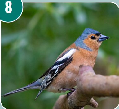
Fågeln heter: C - Bofink