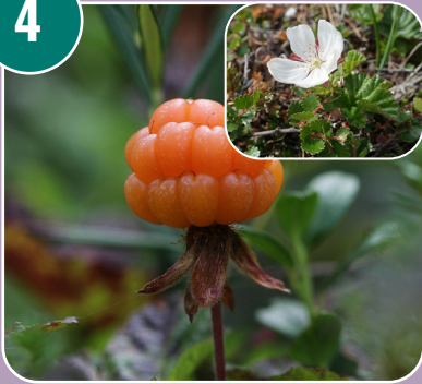
Stenfrukten heter: I - Hjortron