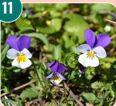
Bilden passar med bokstaven: C