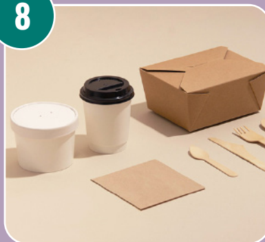
Bilden passar med bokstaven: K