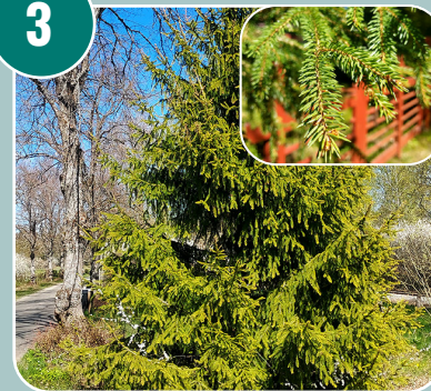
Trädet heter: J - Gran