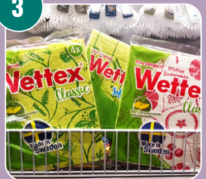
Bilden passar med bokstaven: H