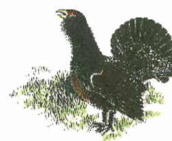
TJÄDERN GAMMELSKOGENS FÅGEL