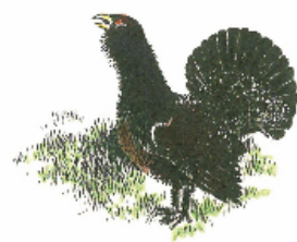
TJÄDERN GAMMELSKOGENS FÅGEL