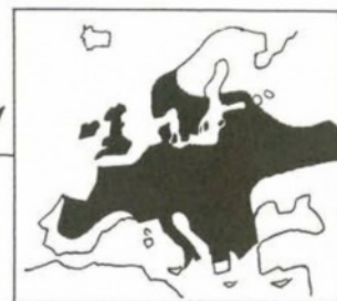
UTBREDNING I EUROPA