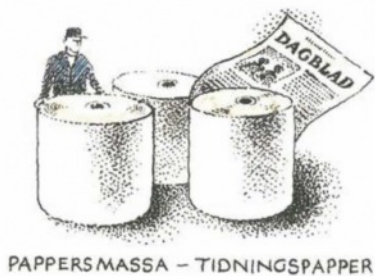
PAPPERSMASSA – TIDNINGSPAPPER