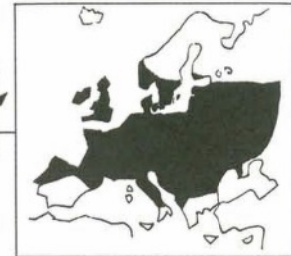
UTBREDNING I EUROPA