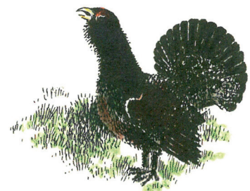
TJÄDERN GAMMELSKOGENS FÅGEL