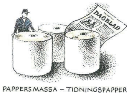
PAPPERSMASSA – TIDNINGSPAPPER