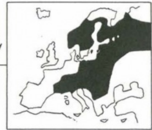
UTBREDNING I EUROPA